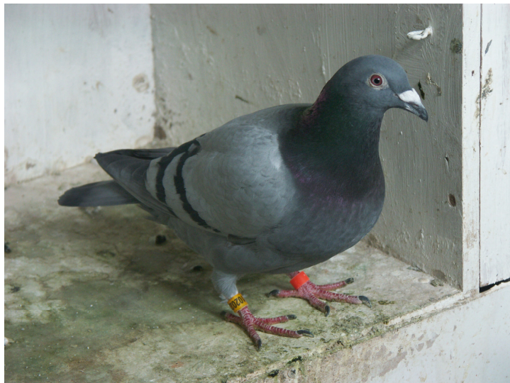
Duif besmet met adenovirus | infectie

Het algemeen ziektebeeld is dat de duiven braken en waterige diarree (stinkend groen tot bruinachtig). Men neemt de duiven in de hand en betast met de andere hand de krop van de duif, deze dient leeg en mooi strak te zijn +/- 12 uren na de laatste voederbeurt. Voelt deze als een spons aan, dan is het foute boel. Op de foto zie je een duif met een adeno besmetting, hier merk je op dat de krop van de duif naar beneden zakt, dit omdat de vertering niet naar behoren functioneert.